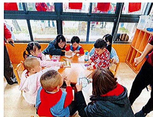
▲幼兒選擇自己喜歡的葉子進行創作畫