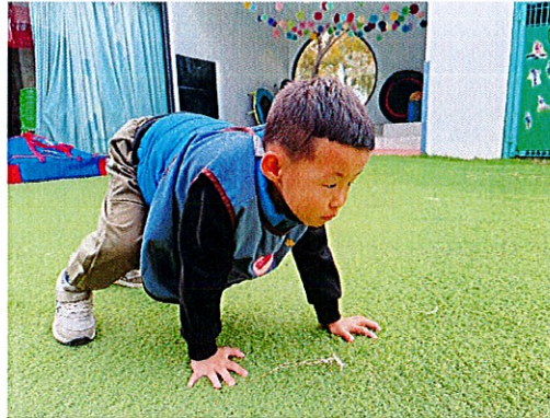
▲幼兒將四肢著地往前走