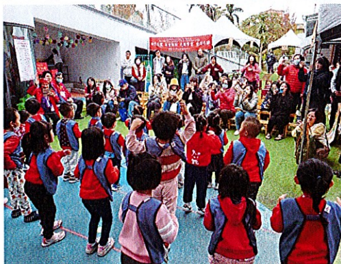
▲星星班新年歌表演