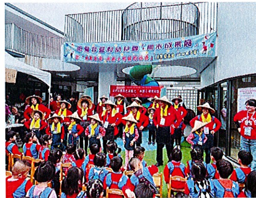
▲老幼共學舞蹈表演