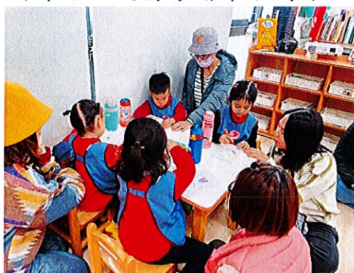
▲幼兒選擇自己喜歡的葉子進行創作畫