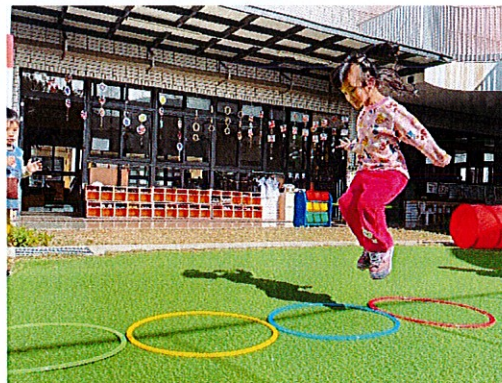
▲幼兒模仿兔子雙腳連續跳五個呼拉圈