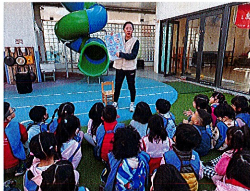
▲老師運用繪本和海報與幼兒介紹行的安全重要性