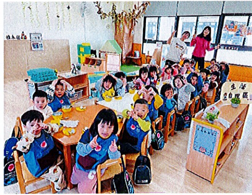
▲星星大家庭一起圍爐