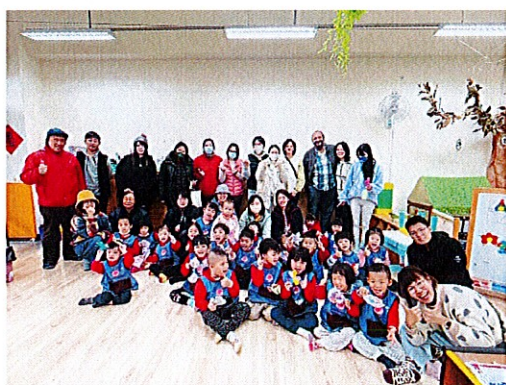
▼星星班大家庭大合照