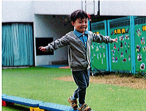
▲幼兒將雙手打開像飛機，走在平衡台上