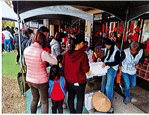
▲幼兒與家長參與幼老共學小時候市集開賣的活動